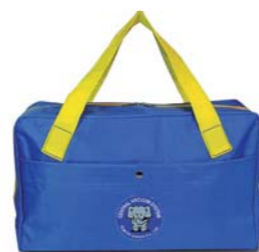
ビバラックプラス専用ケース ソフトケース E509/04562199986045 定価: 7,480 円(税込)

歯ブラシ(ふつ): E501/04562199986023 歯ブラシ(やわらかめ): E502/04562199986030 ミニ歯ブラシ(ふつ): E517/04562199986061 ミニ歯ブラシ(やわらかめ): E518/04562199986078 定価: 各種 1,980 円(税込)