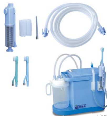
注水・吸引歯ブラシセット

吸引チップで大きな汚れや大量の水も楽々吸引できます。また、口腔内の状態にあわせて注水・吸引歯ブラシセット、吸引歯ブラシセットを併用することで、より効果的なオーラルケアの提供ができます。