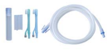
ビバラックプラス用 オプション 吸引歯ブラシセット (吸引機能のみ必要な方)

<セット内容> ミニ歯ブラシ(ふつ)、 ミニ歯ブラシ(やわらかめ)、注水ポンプ、 注水チップ、注水ポンプ用ホース、 ポンプホルダー E562 / 04562199986146 定価: 42,900 円(税込)