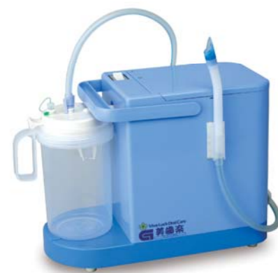
ビバラックプラス (基本セット)

吸引チップで大きな汚れや大量の水も楽々吸引できます。また、口腔内の状態にあわせて注水・吸引歯ブラシセット、吸引歯ブラシセットを併用することで、より効果的なオーラルケアの提供ができます。