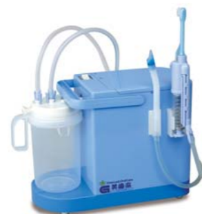
注水・吸引歯ブラシセット/装着例

寸法: W150×D320×H246.5mm <基本セット内容> 電源: 単相100V 本体、水分離器(約800ml)、 電流: 4.0A 吸引チップホルダー、吸引チップ、 出力: 0.50kW 吸引チップ用ホース、清掃用棒ブラシ 質量: 約3.0kg E560 / 04562199986122 定価: 93,500 円(税込)