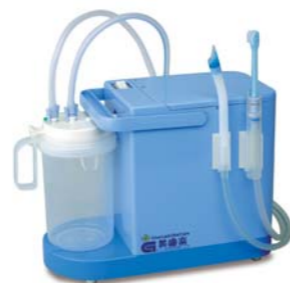
吸引歯ブラシセット/装着例