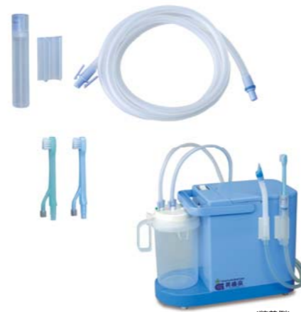
吸引歯ブラシセット

口腔内に溜まった水や唾液を吸引しながらブラッシングができ、さらに手元のボタンを押せば、新鮮な水を注水しながらのブラッシングも可能です。