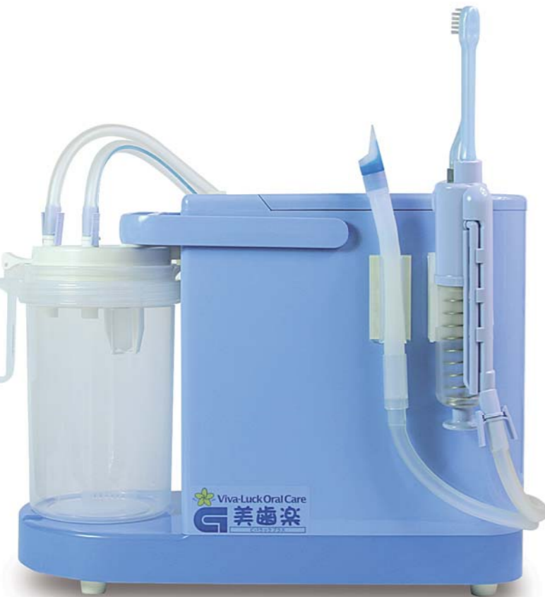
※写真は、ビバラックプラス(基本セット)と注水・吸引歯ブラシセットです。