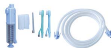
ビバラックプラス用 オプション 注水・吸引歯ブラシセット (注水・吸引機能が必要な方)

<セット内容> ミニ歯ブラシ(ふつ)、 ミニ歯ブラシ(やわらかめ)、注水ポンプ、 注水チップ、注水ポンプ用ホース、 ポンプホルダー E562 / 04562199986146 定価: 42,900 円(税込)